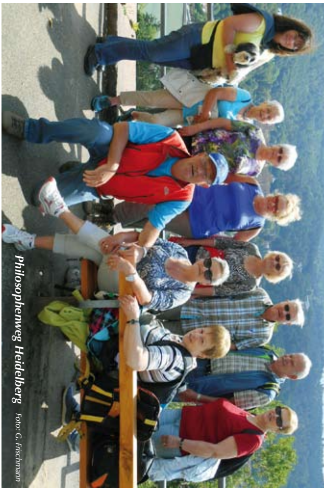
Philosophenweg Heidelberg