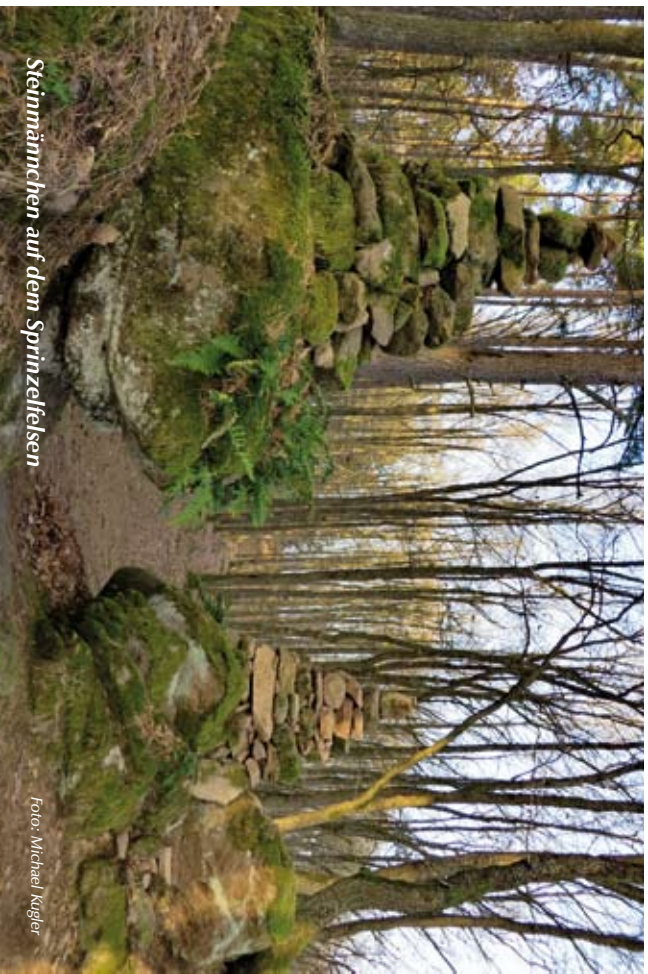
Steinmännchen auf dem Sprinzelfels