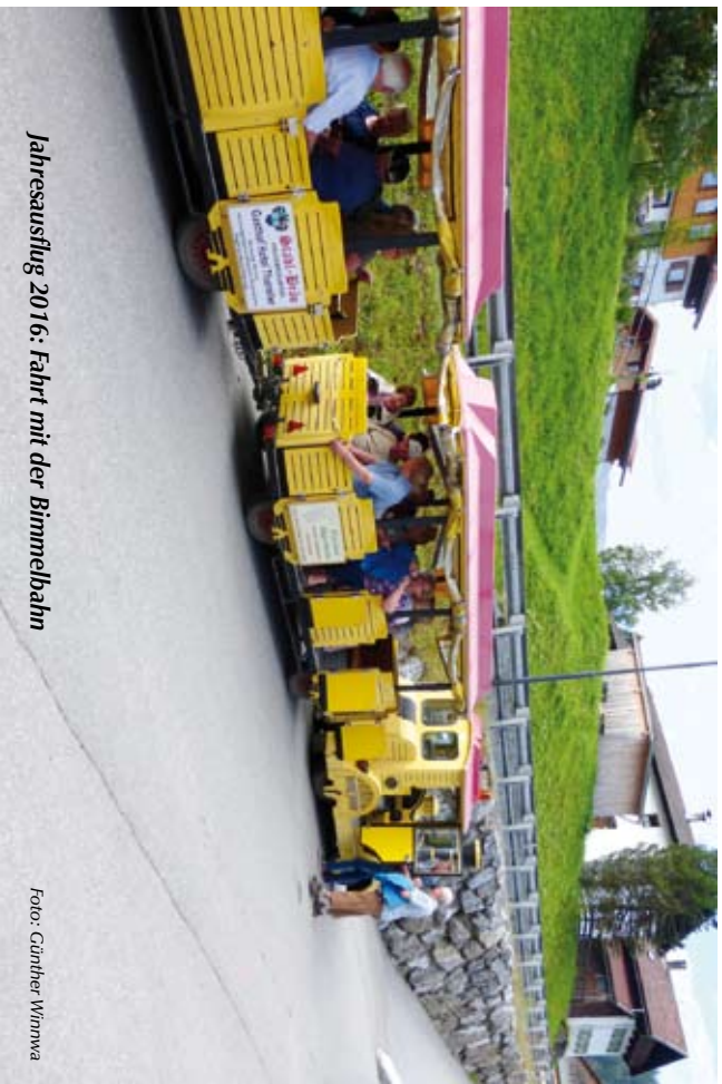
Jahresausflug 2016: Fahrt mit der Bimmelbahn